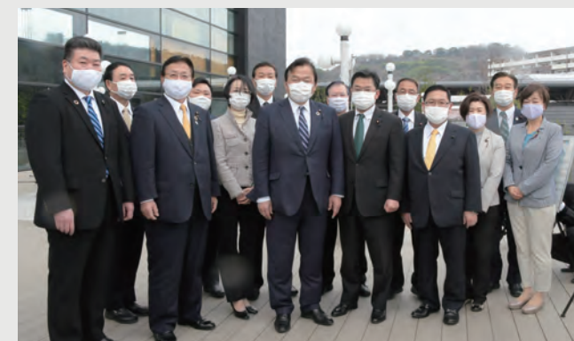
赤羽国土交通大臣と熊本駅周辺を視察