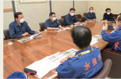
水俣市との意見交換