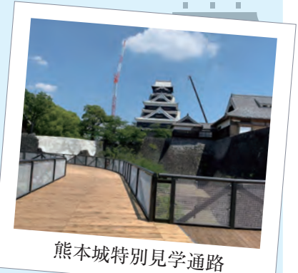
熊本城特別見学通路

令和2年9月定例会・本会議にて一般質問を行います。 市民の皆さまのお力になれるよう頑張ります！