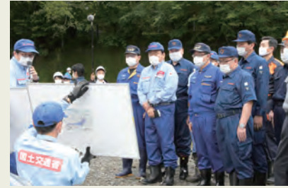
人吉地区 赤羽大臣同行