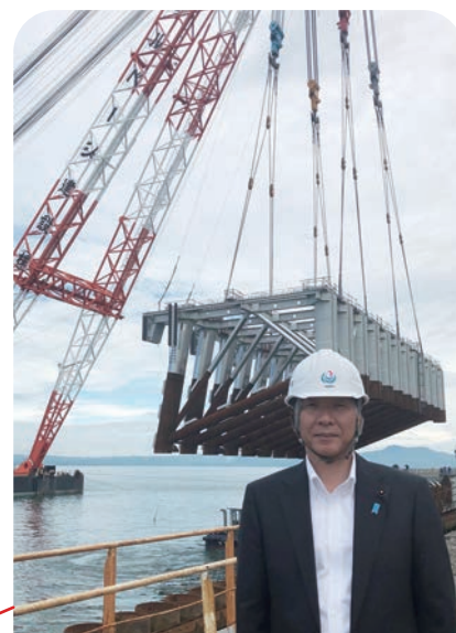
6月28日 八代港クルーズ船専用岸壁整備状況視察