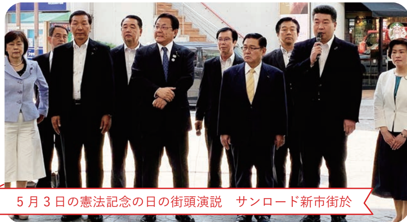
5月3日の憲法記念日の街頭演説 サンロード新市街於