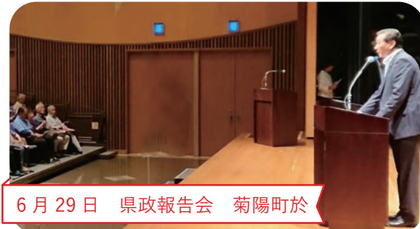
6月29日 県政報告会 菊陽町於